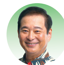
参院議員 高良鉄美