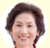
高良鉄美 参院議員