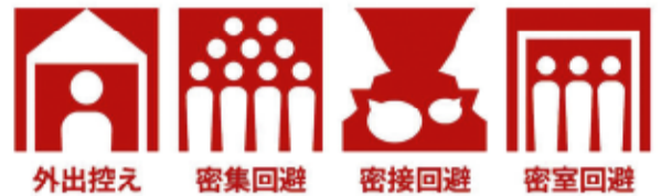
外出控え 密集回避 密接回避 密室回避

自分のため、みんなのため、そして大切な人のため。私たち一人ひとりが、できることをしっかりやっていく。それが私たちの未来をつくります。