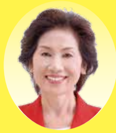
前参院議員 糸数慶子

新基地ストップ! 安倍政治ノー 玉城デニー知事をしっかり支える オール沖縄の若い力